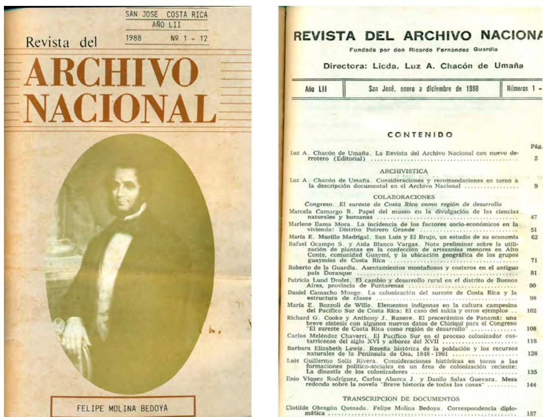
IMAGEN 1. PORTADA Y TABLA DE CONTENIDO DEL AÑO 1988 DONDE APARECEN LAS PRIMERAS SECCIONES DE LA RAN