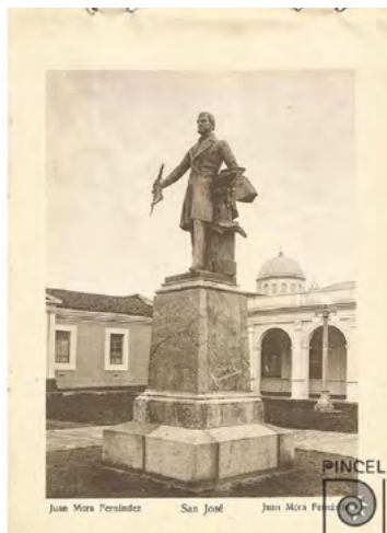
Imagen # 1. Monumento a Juan Mora Fernández. Develada durante las celebraciones del 15 de septiembre de 1921.

Por otra parte, un acontecimiento que muestra la exaltación a los próceres de la patria es la develación de la estatua de Juan Mora Fernández en 1921, que para el discurso oficial es considerado el primer jefe de Estado de Costa Rica. La inauguración de la estatua se llevó a cabo durante los festejos del Centenario de la Independencia.