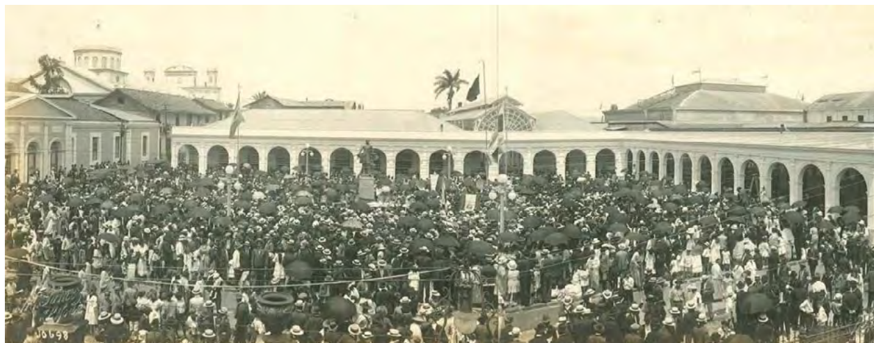
Imagen #3. Celebración del centenario de la independencia de Costa Rica 1921 en San José.

y diputados de la época, la lista era extensa y la participación de escuelas y colegios fue destacado, dando un recorrido colorido que finalizaría en el Parque Morazán, donde además se procedía a cantar los cinco himnos nacionales de los países de Centroamérica.