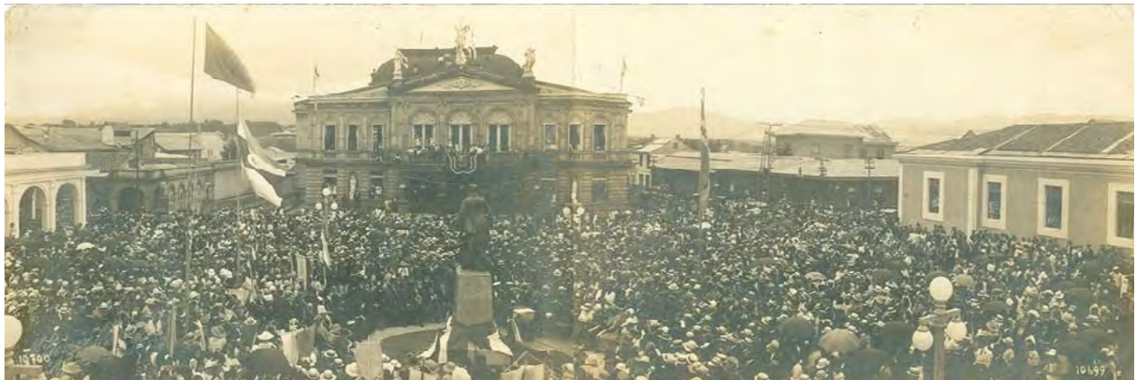
Imagen #2. Celebración del centenario de la independencia de Costa Rica 1921.

En el marco de las celebraciones del Centenario de Independencia de Costa Rica, el periódico La Prensa (17 de septiembre 1921) anunciaba con fervor el éxito de las fiestas patrias, se hace alusión al desarrollo de un gran baile como símbolo de alegría por las celebraciones cívicas, desarrollado, para aquel entonces, en el emblemático Teatro Nacional. La organización de estas fiestas, tenían como fin reunir a la población para conmemorar 100 años de vida independiente, el gran baile, como se menciona en el periódico, fue concurrido. El lugar se decoró alusivo a la bandera de Costa Rica, el escenario estaba destinado para una gran orquesta, y la gente llevaba sus mejores trajes, en los pasillos del Teatro los asistentes hacían notar su mejor perfume, entre tantos abrazos de felicidad que rodeaban el lugar. Sin ninguna duda, el baile es una dinámica que propicia la sociabilidad; las personas participantes se sienten pertenecientes al grupo y comparten sus creencias, valores y costumbres (Ochoa, 2006), y esta era una de las ideas centrales de la actividad realizada.